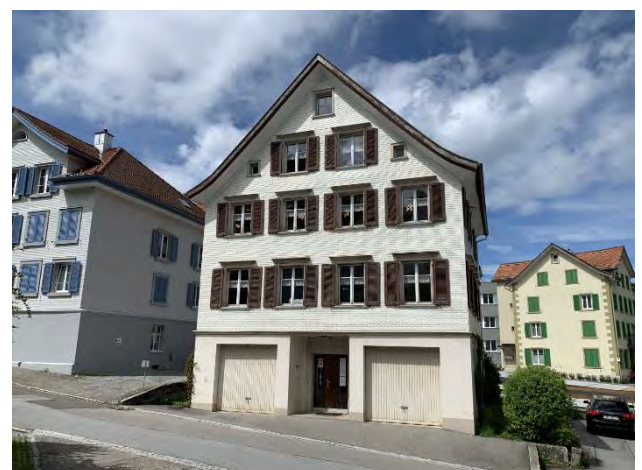
Schulhaus Nef Musikschule / Spielgruppe Dorf, 9428 Walzenhausen