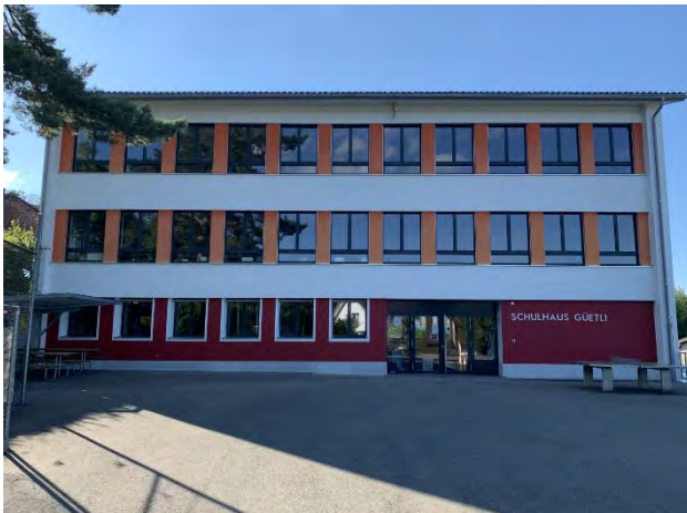
Schulhaus Güetli Primarschule 5./6. Klasse Güetli 181, 9428 Walzenhausen