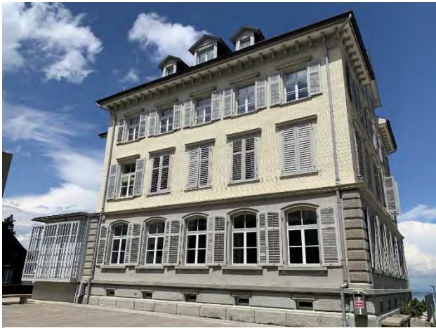
Schulhaus Dorf Oberstufe / Schulleitung / Verwaltung Dorf 69, 9428 Walzenhausen