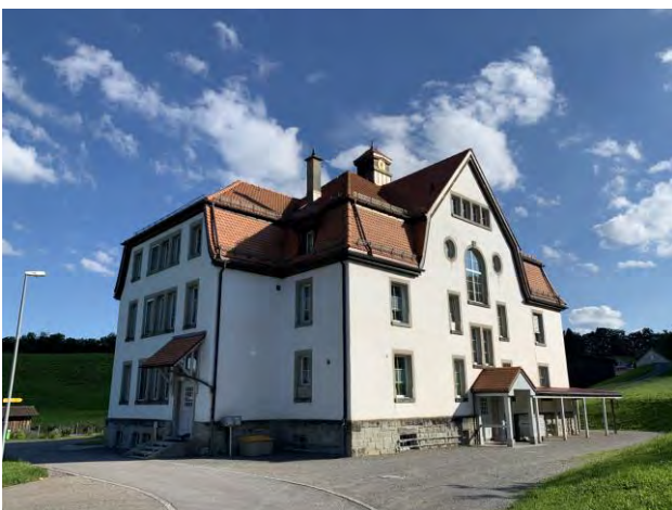
Schulhaus Wilen Primarschule 3./4. Klasse / Kindergarten Tagesstruktur Wilen 396, 9428 Walzenhausen