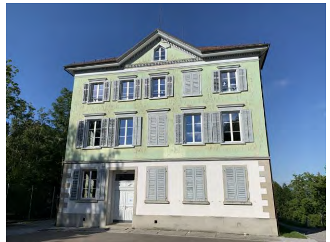
Schulhaus Bild Primarschule 1./2. Klasse Bild 287, 9428 Walzenhausen