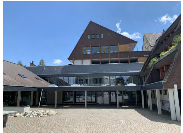
Mehrzweckanlage MZA Oberstufe / Sportanlage / Bibliothek Dorf 68, 9428 Walzenhausen